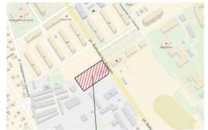
место выполнения работ